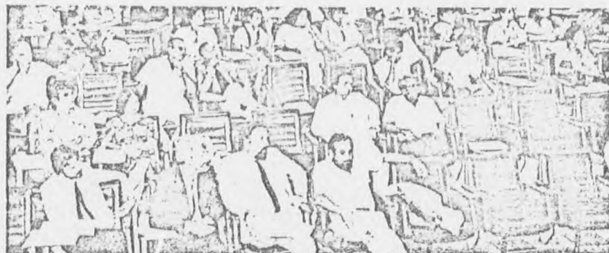
No Distrito Federal, foi proposta a criação de Conselhos Comunitários de Saúde