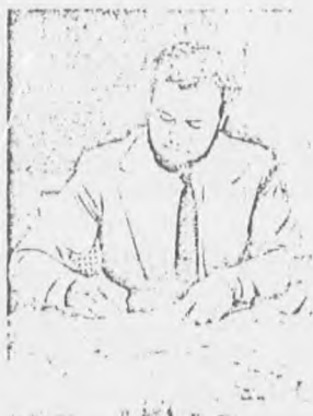
Eleutério sugere uma nova estratégia

Reformulações do Sistema Nacional de Saúde - Este é o título de um documento preparado pelo secretário-geral do Ministério da Saúde, Eleutério Rodrigues Neto, que será apresentado na 8ª Conferência Nacional de Saúde. A primeira parte do documento discute os desacertos, as iniquidades e as inadequações do atual Sistema Nacional de Saúde, apontando a necessidade de uma reformulação. O baixo nível de saúde da população (inclusive quanto a doenças preveníveis por ações específicas dos serviços de saúde), diz o documento, é o resultado das insuficiências legais e conceituais que regem, com irracionalidade e excessiva centralização, a organização dos serviços de saúde no país. A consequência é que o direito à saúde, embora expresso na própria Constituição Nacional, não pode ser assegurado à população brasileira. A segunda parte do documento fala sobre o que seria um modelo ideal de sistema de saúde em uma sociedade democrática, assim como sobre os princípios para sua organização, universalização, equidade, descentralização (com regionalização e hierarquização), participação e integração. O terceiro ca-