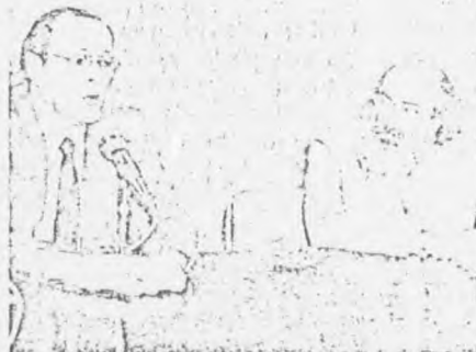
Sant'Anna e o presidente da Conferência, Sérgio Arouca

é responsável por toda sorte de aberrações sociais. É preciso, fundamentalmente, distribuir de forma mais equânime a renda nacional. Após criticar a descoordenação existente entre as ações de saúde desenvolvidas pelos diversos órgãos das várias esferas de governo, Carlos Sant'Anna disse que devem ser buscadas a descentralização, a integração e a participação de todos na política nacional de saúde. Segundo o Ministro, é também prioritária a equiparação salarial de todos os profissionais que trabalham com saúde.